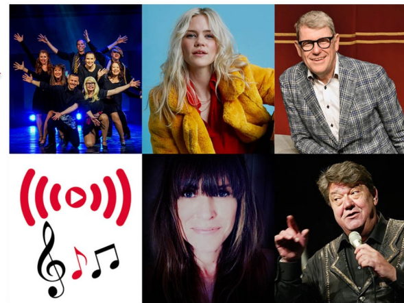
Websänd konsert nov 2020 + Youtube